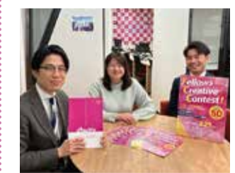
Fellows Creative Contest 実行委員会メンバー

た私たち自身の意識変革にもつながりました。また、このコンテストによって、フェローズの新しいサービスや取り組みをより多くの方に知っていただくことができましたと感じています。自社の社内外に対するブランディングにお困りの方は、こういったコンテストの開催などに、ぜひ挑戦してみてください。