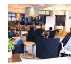
毎月恒例フェローズ主催イベ ントin Hawaii。盛り上がるディ スカッション。

Aloha! 先日、ハワイで60年以上の歴史があるサーフ ショップのオーナーにお会いしましたが、実は元々は日 系の方が設立したビジネスでした。当時、お客様には多 くの日本人観光客がいたようですが、近年は新興企業の 進出が目覚ましいとのこと。現在、店舗とECサイトの一 元管理とデジタルマーケティングなどのお手伝いをさせ ていただくべくお話ししています。 現在のハワイは、多くの企業が採用に苦戦しています。ク リエイティブ以外にも、ハワイの人材ニーズにお応えしま すので、お知り合いにアメリカでのご就業が可能の方が いらっしゃったら、ぜひご紹介ください。Mahalo!