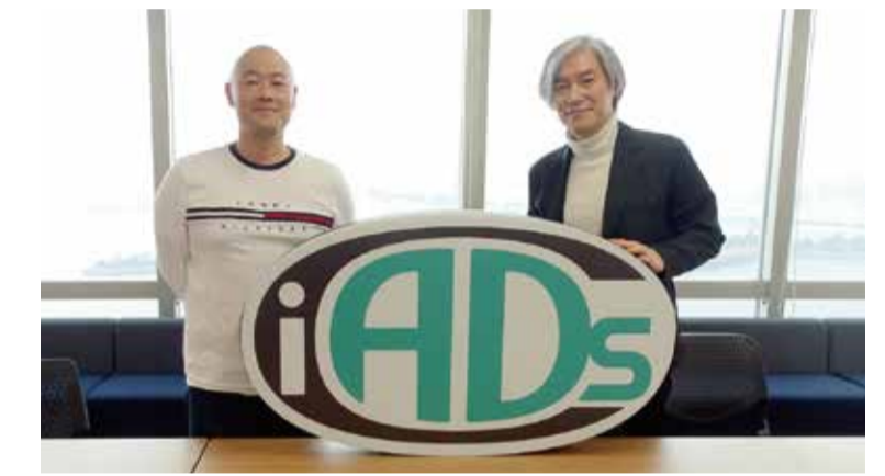
ライター:カネコシュウヘイ