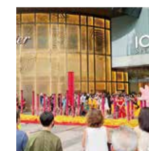
旧正月シーズンのライオンダ ンスとそれを見る人々

Hello Japan! シンガポールでは2月13日から公共交通機 関においてもマスク着用義務がなくなりました!シンガ ポール政府からは事実上のパンデミック終結の声明が 発表され、多くの人がマスクをすることなく生活を送っ ています。旅行者も増加中で2年以内にコロナ前まで回 復する見通しとされています!皆さまも機会があれば ぜひシンガポールへの旅行をご検討ください! 海外向けクリエイティブ制作を外国人クリエイターに直 接依頼したい日本の企業様。ぜひお気軽に以下のウェブ サイトよりお問い合わせください。 https://fellow-s.com.sg/fellows-creators/