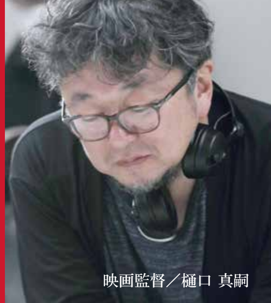
映画監督／樋口 真嗣